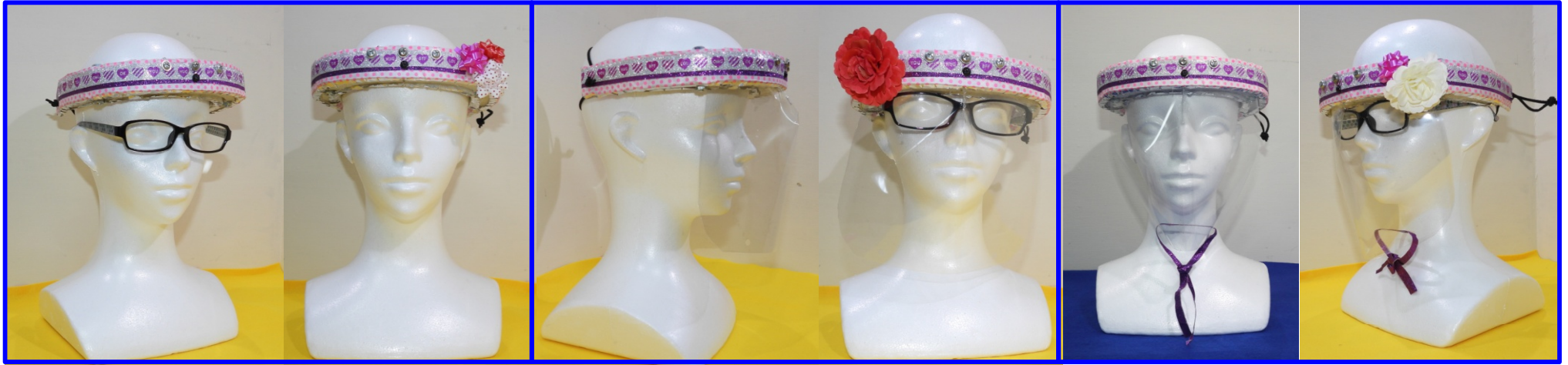
多機能ヘアバンド